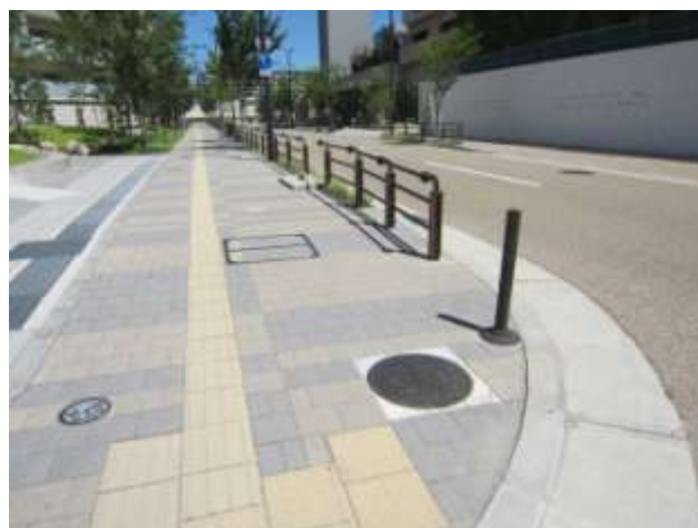
目地のない舗装ブロック・やわらかい車止め