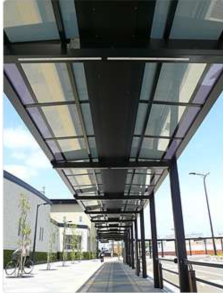
①シェルター（シースルーの太陽電池モジュールが一体化したシェルター）